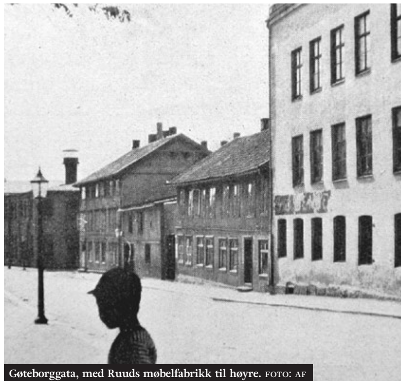
Gøteborggata, med Ruuds møbelfabrikk til høyre.

der det luktet mer av kakaobønner. Godlukten satte meg på ny i godt humør, og jeg glemte de fæle dunstene.