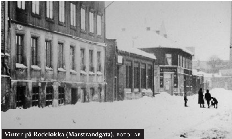
Vinter på Rodeløkka (Marstrandgata).

Hjemme på fabrikken våknet jeg til sjokoladedufter, men visste at veien til Sofienberg skole på Grünerløkka ville sette sansene på prøve. Bli med meg på turen, en varm dag på forsommeren: