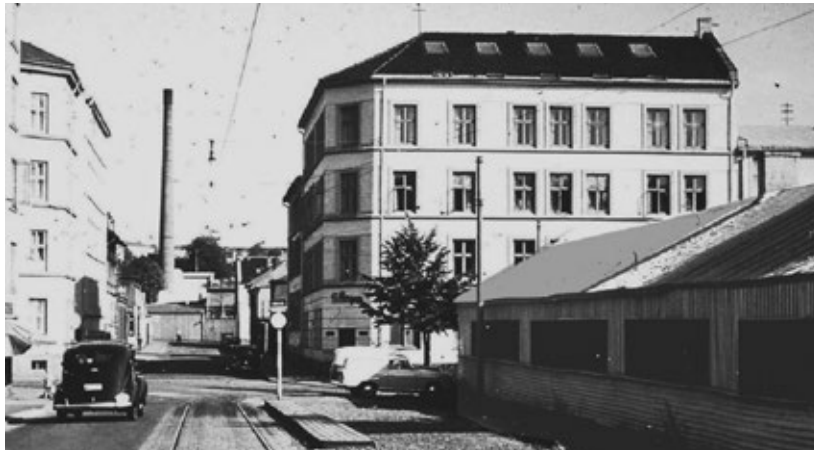
Bergene sjokoladefabrikk. De tre vinduene øverst til høyre var våre.

Med tiden fikk vannhjulene selskap av motorer. Smarte hoder startet fabrikker. Tidlig på 1900-tallet hadde Rodeløkka tiltrukket seg Norges mest luktsterke virksomheter.