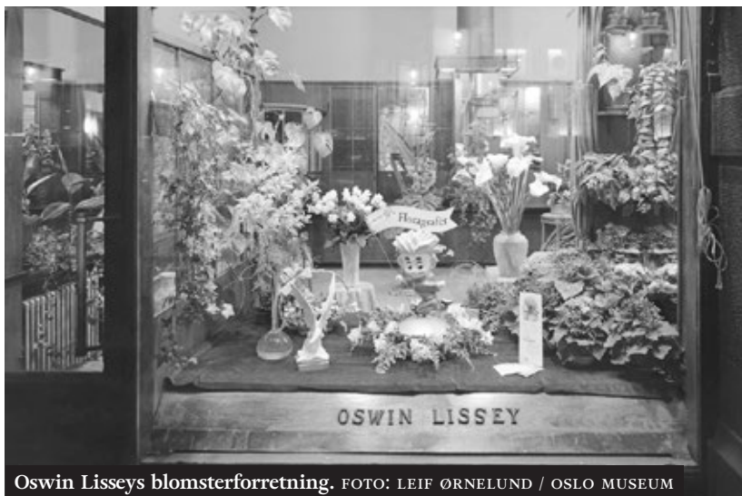
Oswin Lisseys blomsterforretning.

Jeg fortsatte ned Storgata forbi østkantluktenes siste utpost: Det gamle gassverket overfor legevakta produserte kullgass, også kalt bygass, som stakk i nesa.