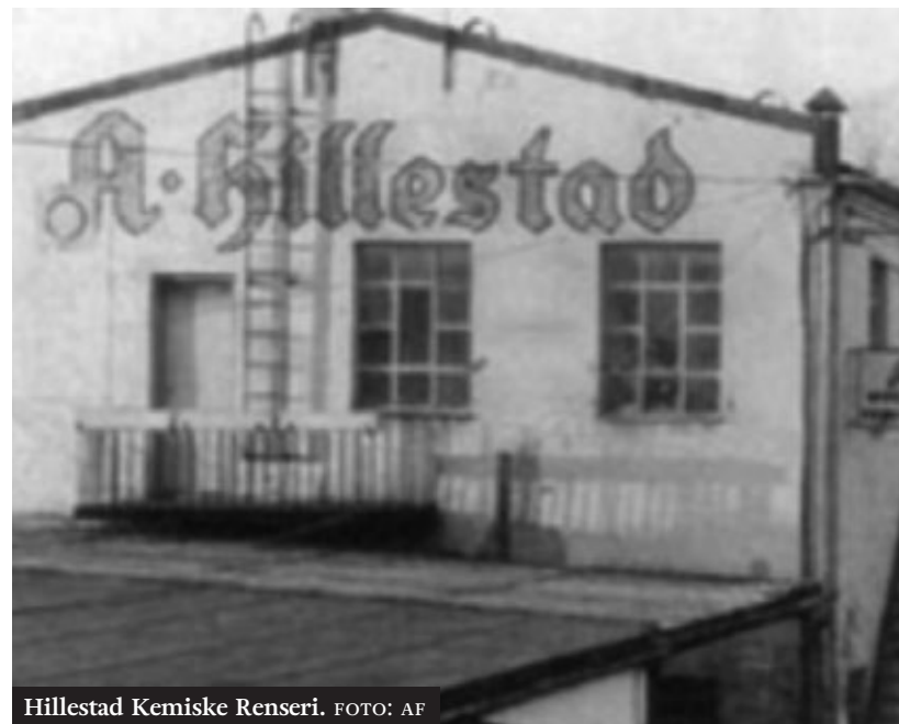
Hillestad Kemiske Renseri.

I små mengder likte jeg bensinlukten. Det hendte jeg sto bak biler og snuste på eksosen. På den tiden visste ingen at det var farlig. Den skumleste av luktene fra renseriet var trikloretylen, kalt tri. Det etset bort fett, og liknet kloroform og tyner. Vi gutta likte å utforske luktene ved ventilasjonsviften. Vi dro luften ned i lungene som om det gjaldt livet. Når tri var blant gassene begynte