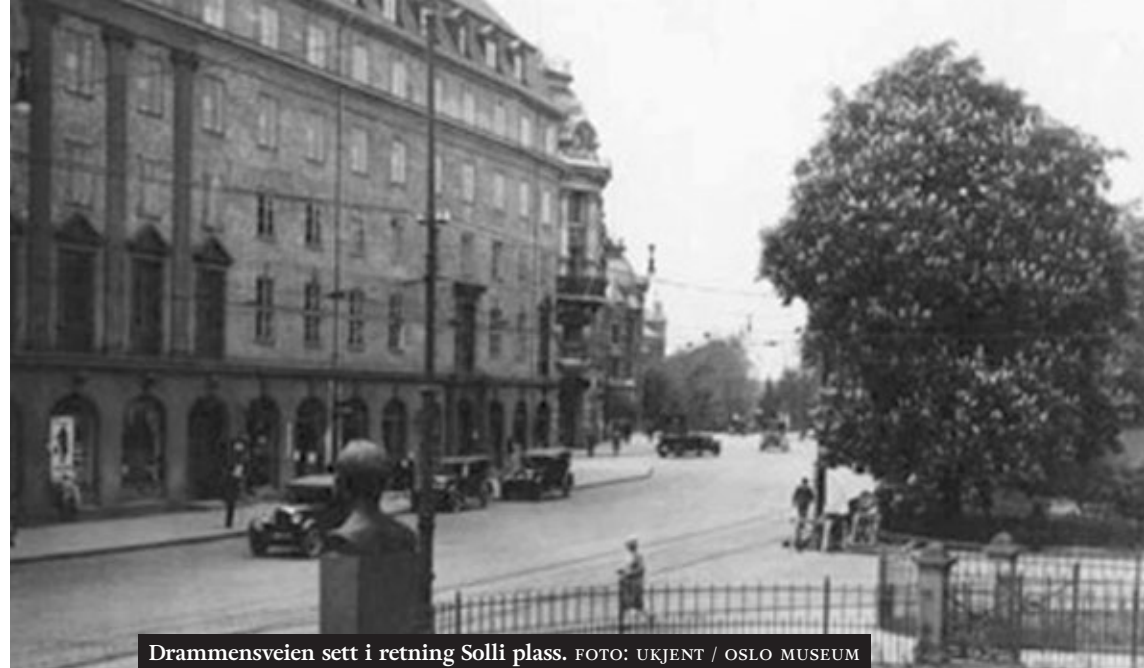
Drammensveien sett i retning Solli plass.

Nå var jeg på selveste Vestkanten. I Bygdøy allé duftet høye kastanjetrær deilig av vår og sommer. Velkledder damer og husgjelder vannet blomstrende balkonger. Frisk havbris strømmet opp fra Frognerkilen. Dette var en helt annen by der hus og mennesker var rene og luktet godt.